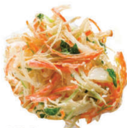
183. Tempura di verdure miste alla julien 🌿