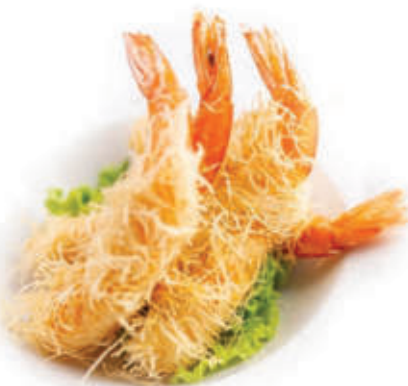
188. Gamberoni kataifi 2pz gamberoni avvolti in pasta kataifi alla carta 6pz