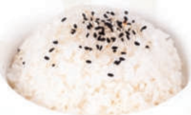
170. Riso bianco al vapore 🌱