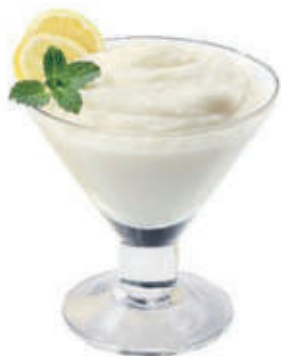
Sorbetto limone € 2.90