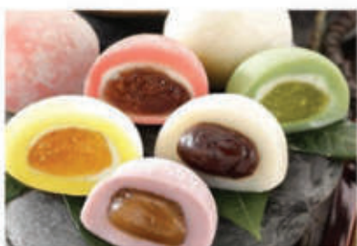
Mochi gelato Tipico dolce giapponese di riso glutinoso farcito con gelato con una consistenza morbida, soffice e gommosa 3 pz (gusto assortiti) € 4.50