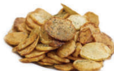
17. Patate saltate 🌿