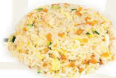
171. Riso saltato con verdure 🌱