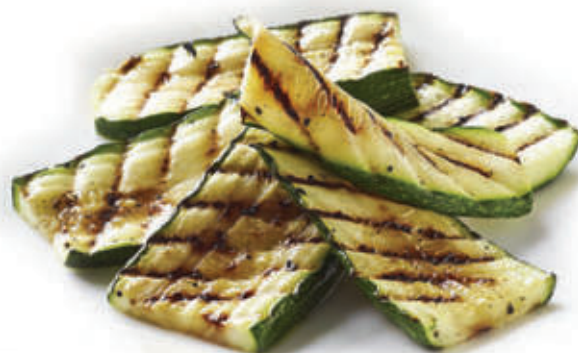
232. Zucchine alla griglia 🌱