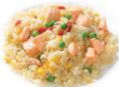
174. Riso saltato con salmone e verdure