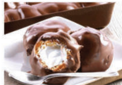
Profiterole al cioccolato nero € 4.00