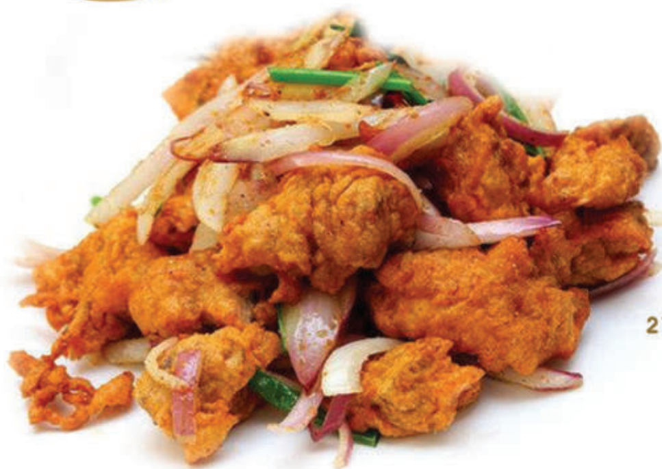
218. Pollo sale pepe petto di pollo saltato nel wok sale e pepe*