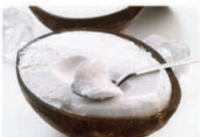
Cocco ripieno € 3.90