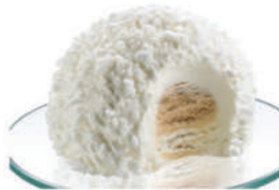
Tartufo bianco € 3.90