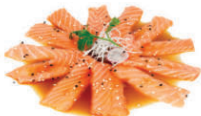
320. Carpaccio di salmone con salsa ponzu € 10.00 allergeni: 4,6,11