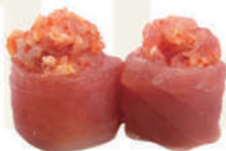
328. Gunkan spicy tuna )