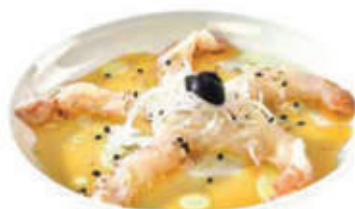
324. Carpaccio amaebi € 13.00 MAX 1 porz. a persona allergeni: 2*