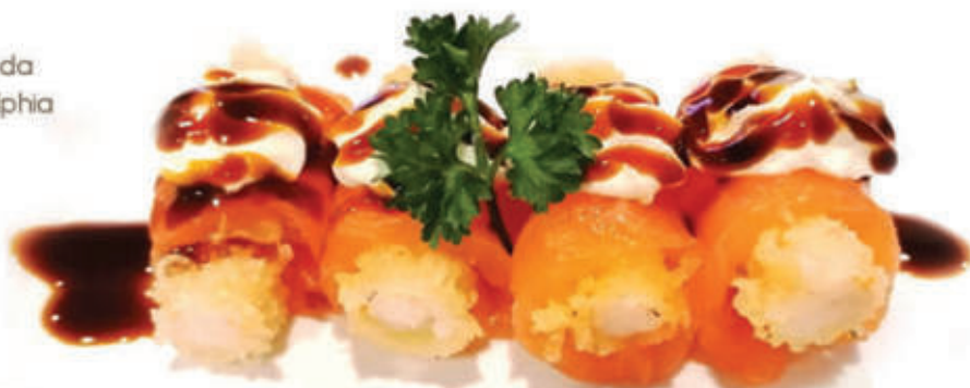
326. Involtino sake ebi gambero in tempura avvolto da carpaccio di salmone, philadelphia e salsa teriyaki 4pz MAX 1 porz. a persona alla carta 6pz € 8.00 allergeni: 1,2,3,4,6*