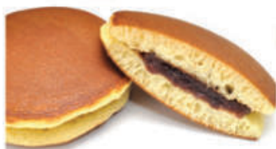
Dorayaki della casa (popolare dolcetto giapponese, formato da un impasto morbido simile al pancake farcita alla nutella) € 4.50