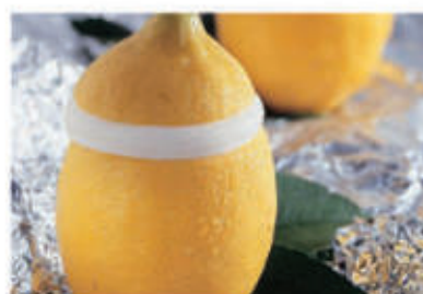
Limone ripieno € 3.90