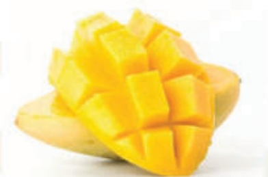
Mango fresco € 3.90