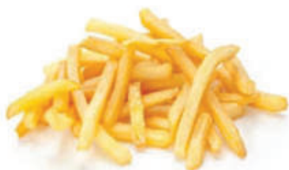
15. Patatine fritte* 🌿