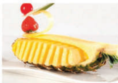
Ananas fresco € 3.90