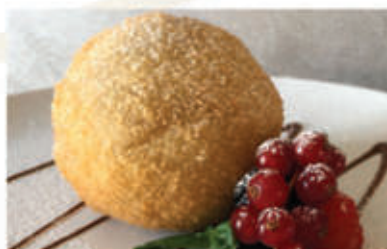
Gelato fritto gelato crema € 4.50