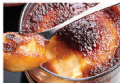
Coppa crema catalana € 4.50