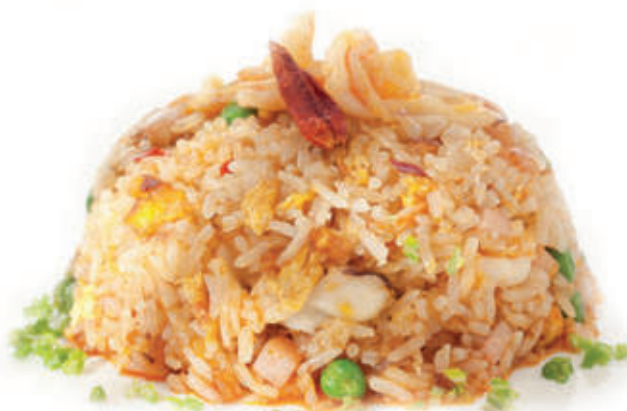
177. Riso saltato alla pechinese ) pollo e verdure salsa piccante