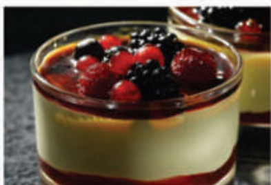
Coppa crema brulée e frutti di bosco € 4.50