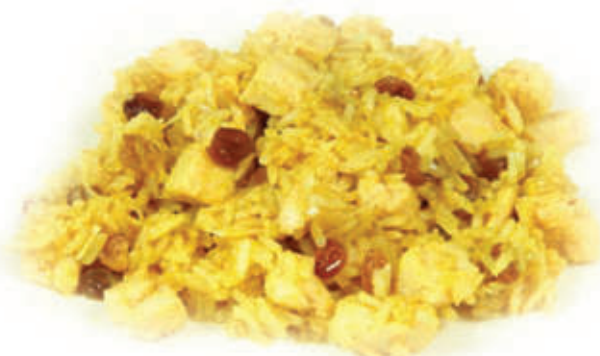
176. Riso al curry con pollo e verdure