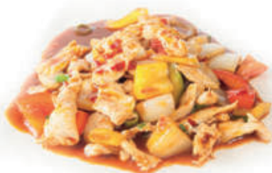
220. Pollo spicy ) piccante