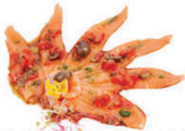
323. Carpaccio all'olio E.V.O. tartufata e pomodorini MAX 1 porz. a persona € 12.00 allergeni: 4