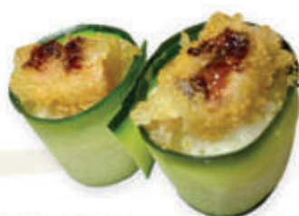
331. Gunkan zucchini ebi

Bocconcino di riso avvolto con zucchini guarnito con tempura di gamberi e salsa teriyaki alla carta 2pz