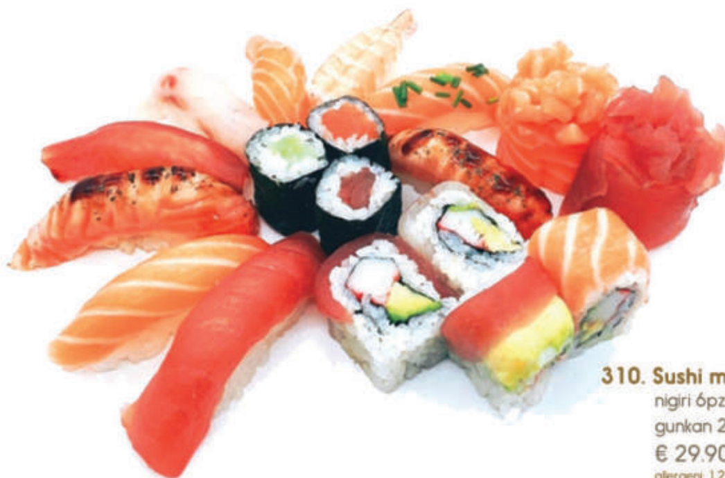
310. Sushi misto grande nigiri 6pz, uramaki 8pz, gunkan 2pz, sashimi 10pz € 29,90 allergeni: 1,2,3,4