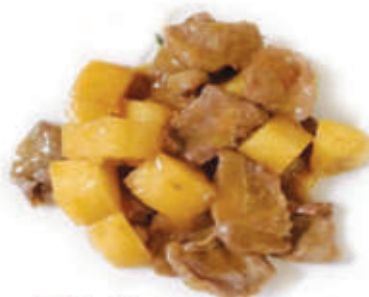
221. Manzo thailandese con patate e curry