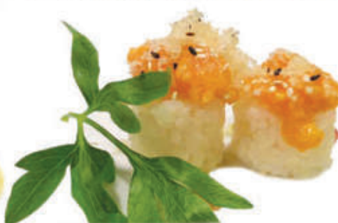
334. Tamarizushi salmone )