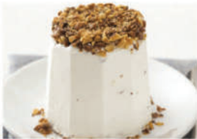
Semifreddo torroncino € 3.90