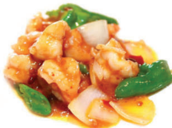
229. Gamberi spicy ) piccante