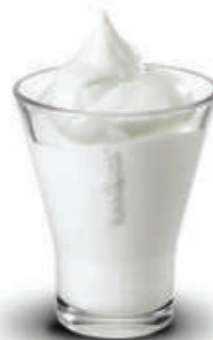
Sorbetto di riso € 2.90