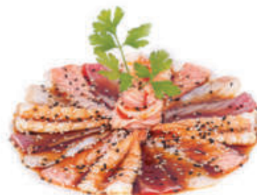
322. Carpaccio misto scottato in salsa ponzu, erba cipollina e olio E.V.O. MAX 1 porz. a persona € 13.00 allergeni 4,6,11