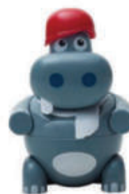
Hip Pop Gelato alla fragola € 4.50

accompagnato con gelato alla crema € 4.90