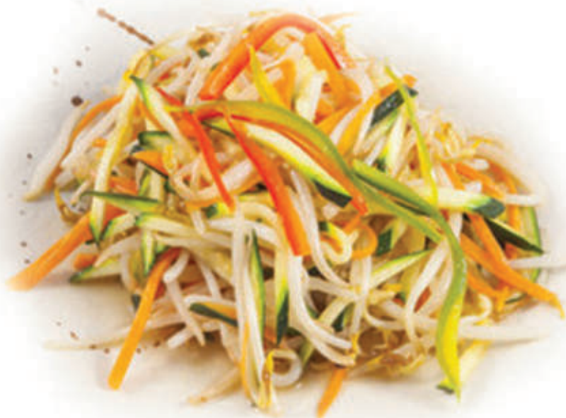
230. Misto verdure saltate 🌱