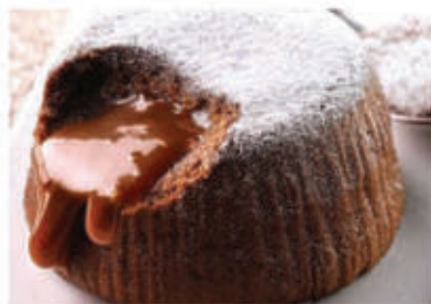
Soufflè al cioccolato nero € 3.90

accompagnato con gelato alla crema € 4.90