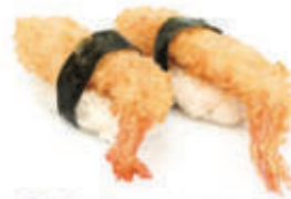
305. Gambero Fritto