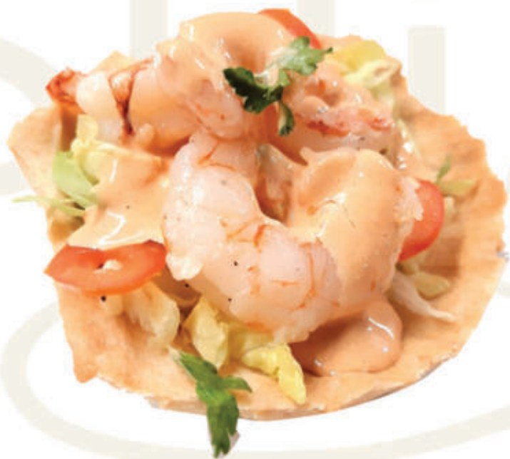
18. Cocktail di gamberi