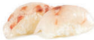
302. Branzino € 3.00 allergeni: 4