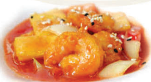
226. Gamberi in agrodolce