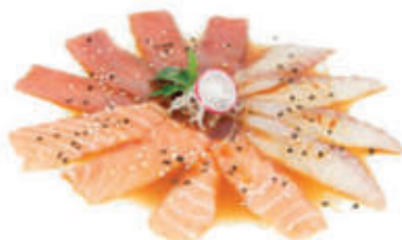
321. Carpaccio misto con salsa ponzu € 10.00 allergeni: 4,6,11