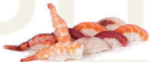
307. Sushi misto nighiri 6 nighiri (salmone, tonno, branzino, gambero cotto) alla carta 10pz € 10,00 allergeni: 2,4