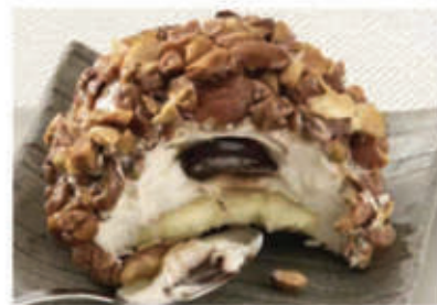
Croccante al pistacchio € 4.50