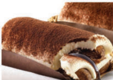
Tiramisù € 4.50