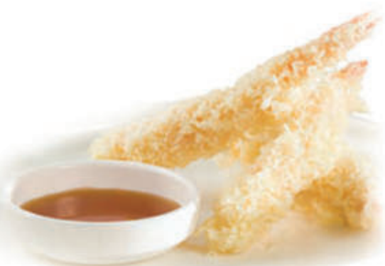
181. Ebi tempura Gamberoni fritti alla carta 6pz