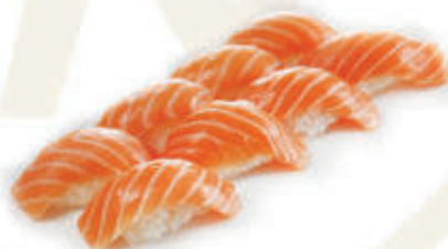
308. Sushi sake 6 nighiri salmone alla carta 10pz € 10,00 allergeni: 4