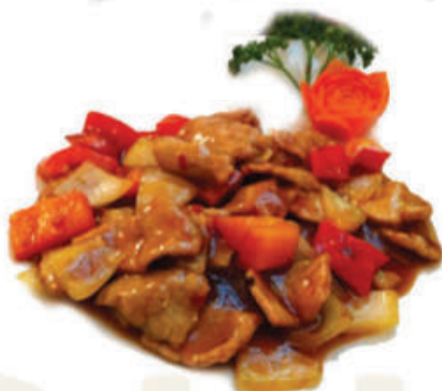
223. Manzo spicy ) piccante