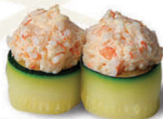
332. Gunkan zucchini crab

Bocconcino di riso avvolto con zucchini scottata guarnito con polpa di granchio alla carta 2pz