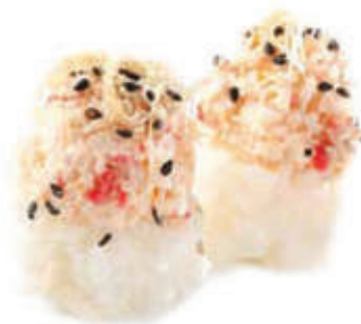
335. Tamarizushi crab