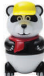
Pan Dan Gelato al gusto vaniglia € 4.50