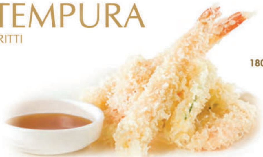
180. Tempura moriawase Gamberoni e verdure fritti