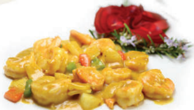
227. Gamberi al curry