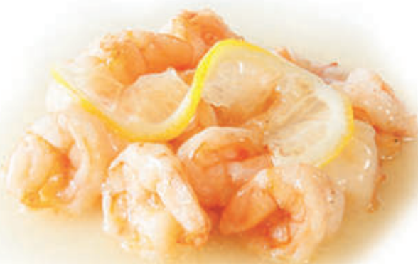
228. Gamberi al limone