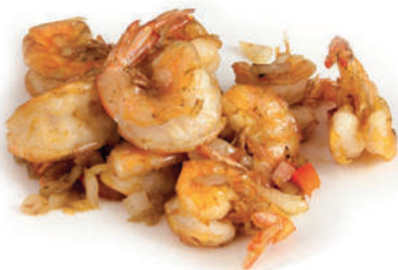
233. Gamberi sale e pepe