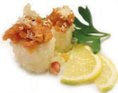
333. Tamarizushi tonno )

BOCCONCINI DI RISO CON TARTARE DI PESCE E TEMPURA CROCCANTE