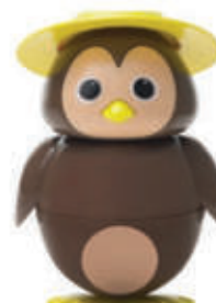
Cip Ciok Gelato al cioccolato € 4.50