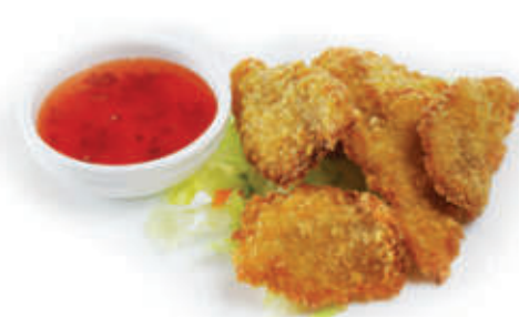
217. Pollo fritto tori no karage bacconcini impanati