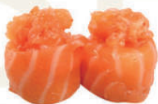
327. Gunkan spicy salmon )