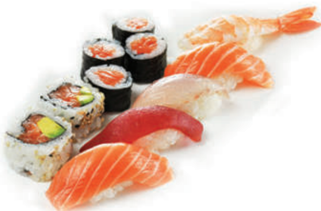
309. Sushi misto piccolo nigiri 5pz, uramaki 4pz, hossomaki 4pz € 10,00 allergeni: 2,4