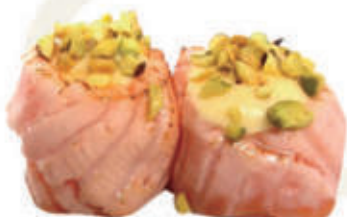
330. Gunkan scottato

salmone scottato, pistacchio, salsa mango, teriyaki alla carta 2pz