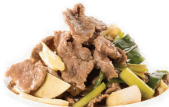
224. Manzo con zenzero e cipollotti