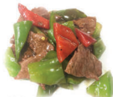
222. Manzo saltato con cipolla e peperoni