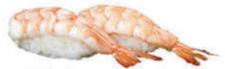
303. Gambero cotto € 3.00 allergeni: 2*