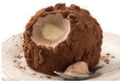
Tartufo nero € 3.90