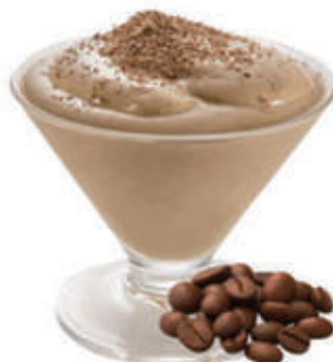
Sorbetto al caffè € 2.90