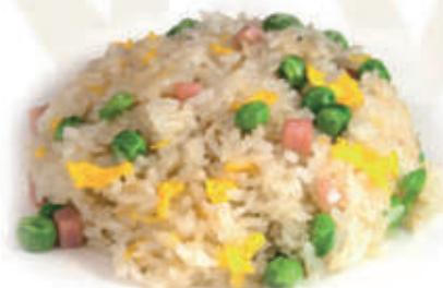
172. Riso cantonese