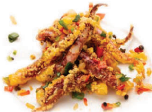
234. Calamari sale pepe ciuffi di calamari sale e pepe