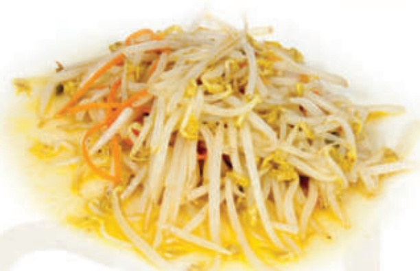
231. Germogli di soia saltati 🌱