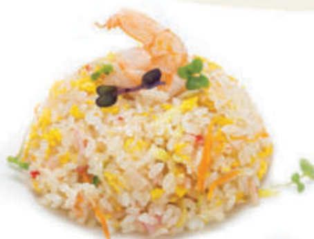
173. Riso saltato con gamberi e verdure