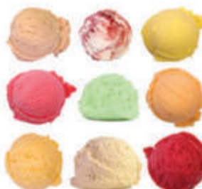
Gelato (3 palline a scelta: riso, the verde, cioccolato, limone) per altri gusti chiedere al personale € 3.90