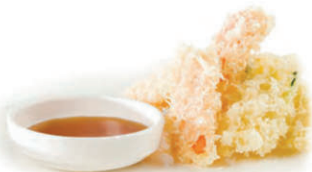
182. Yasai tempura 🌱 verdure fritte