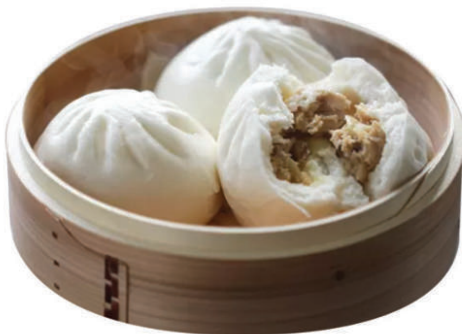
28. Bao con ripieno di carne 1pz