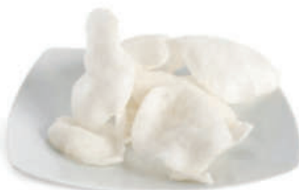
16. Nuvole di gamberi