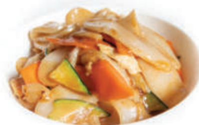
175. Gnocchi di riso gamberi e verdure