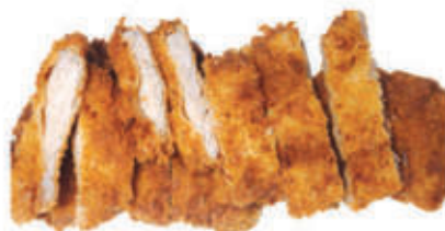
184. Cotoletta impanata tunkutsu