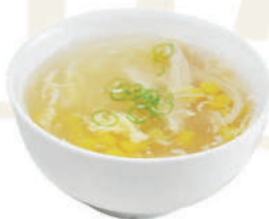
26. Zuppa di mais e pollo