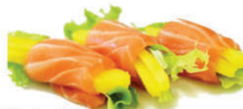
325. Involtino di mango mango avvolto con carpaccio di salmone e salsa mango 3pz alla carta 10pz € 7.00 allergeni: 4