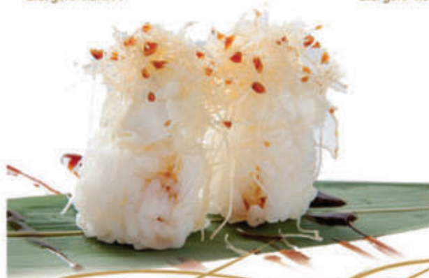
336. Tamarizushi philadelphia 🌱